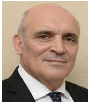
JOSÉ LUIS ESPERT