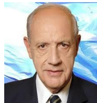
ROBERTO LAVAGNA 10,0%