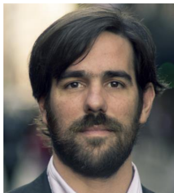
NICOLÁS DEL CAÑO 5,5%