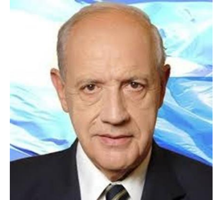
ROBERTO LAVAGNA 13,7%