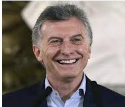
MAURICIO MACRI 25,3%