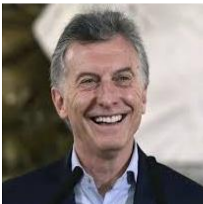
MAURICIO MACRI 21,5%