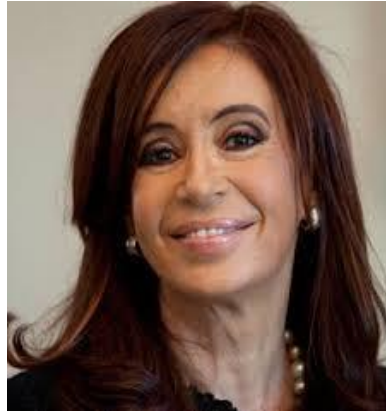
CRISTINA KIRCHNER 29,7%