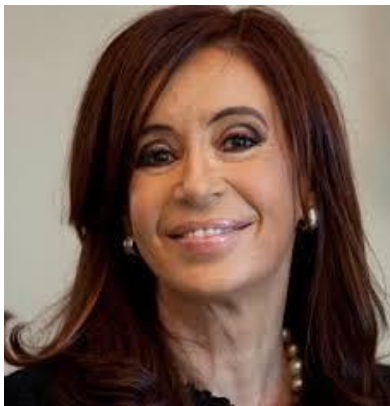
CRISTINA KIRCHNER 31,5%