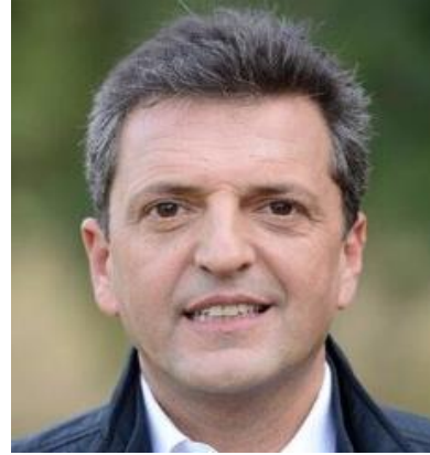
SERGIO MASSA 13,9%