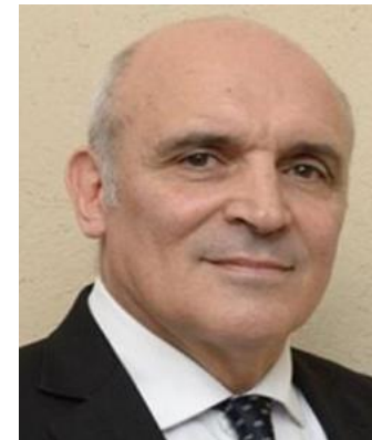
JOSÉ LUIS ESPERT