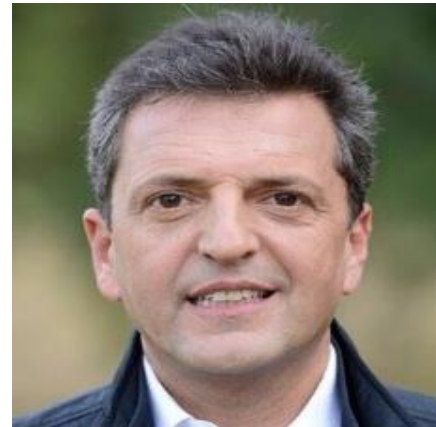
SERGIO MASSA 17,2%