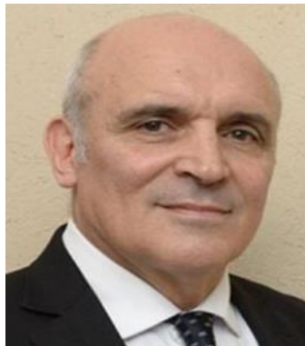
JOSÉ LUIS ESPERT 4,9%