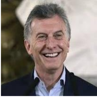
MAURICIO MACRI 30,5%