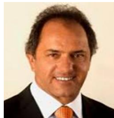
DANIEL SCIOLI 2,6%