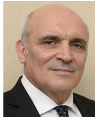
JOSÉ LUIS ESPERT