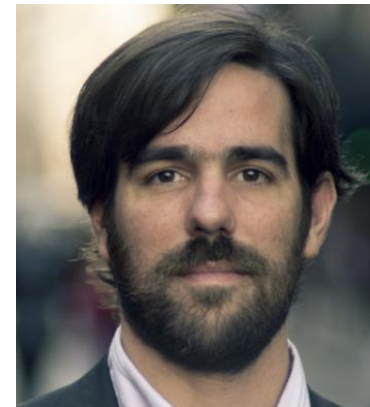
NICOLÁS DEL CAÑO 5,4%

Porcentajes con proyección proporcional de indecisos (8,9%) y votantes en blanco (3,6%)