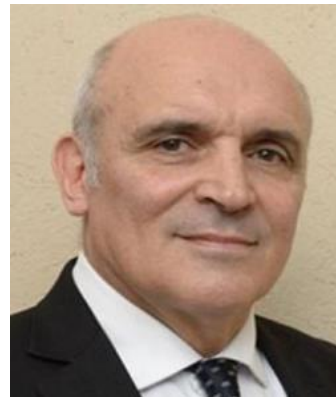
JOSÉ LUIS ESPERT 5,5%